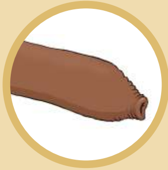
Pénis não circuncisado