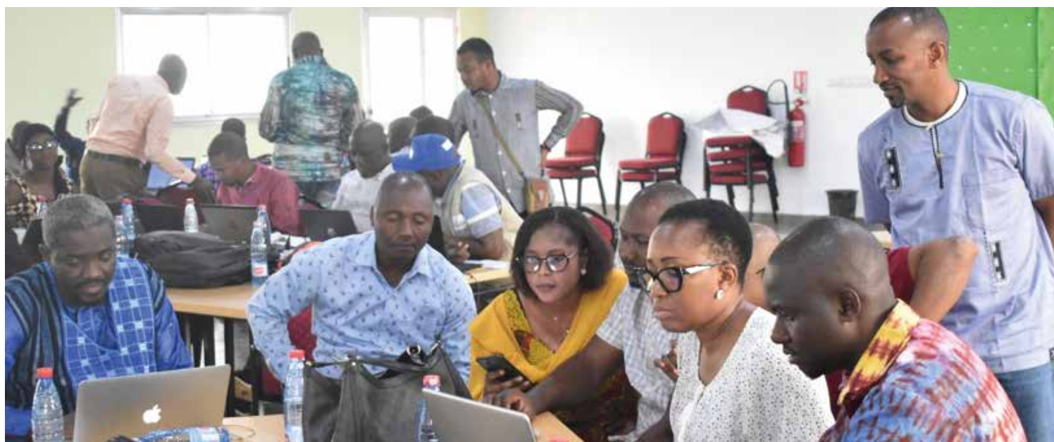
Travaux de groupe sur les objectifs de communication, supervisés par les facilitateurs de l'atelier (Kindia, mars 2024)