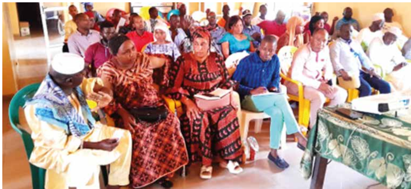
Session de plaidoyer en faveur de la vaccination (Téliélé, mars 2024)

En mobilisant les autorités locales et les leaders d'opinion, elles contribuent à renforcer l'adhésion communautaire à cette pratique essentielle pour la prévention des maladies et la promotion de la santé publique.