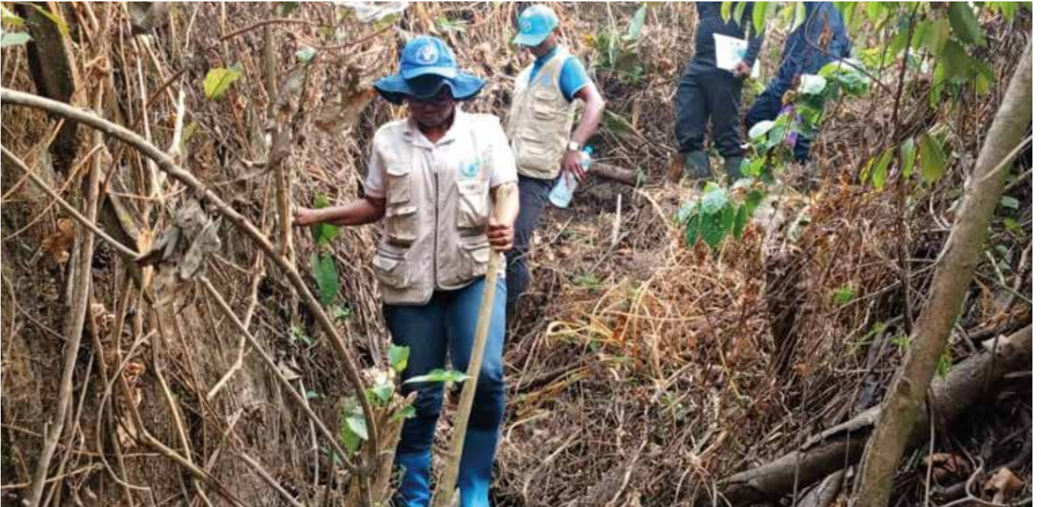
Une mission d'exploration de la FAO en région forestière (Nzérékoré, février 2024)

Face à la recrudescence cyclique des fièvres hémorragiques virales en Guinée, la FAO, dans le cadre du projet de soutien à la sécurité sanitaire mondiale (GHS)-Afrique financé par l'USAID, a mis en place une surveillance active à l'interface homme-animal-environnement pour contribuer à détecter précocement et déterminer la source zoonotique des fièvres hémorragiques.