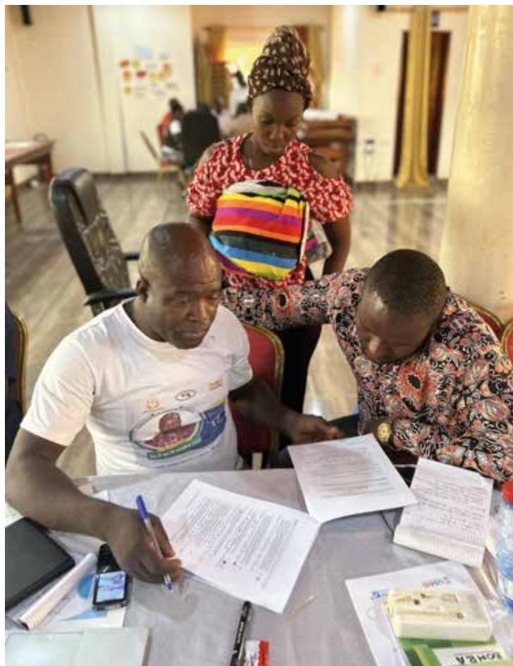
Durant une activité de groupe, des participants de Nzérékoré utilisent l'outil de vérification de l'égalité du genre pour évaluer le niveau d'intégration de la dimension de genre dans leurs activités de communication sur les risques et d'engagement communautaire existantes et en cours. (Nzérékoré, février 2024)

En élaborant et en mettant en œuvre un programme de formation complet, le personnel du projet a cherché à élargir la compréhension des participants sur le genre et son rôle intégral dans les programmes de santé. Des sessions interactives et des exercices pratiques ont permis de clarifier les concepts de genre, en remettant en question les stéréotypes et les normes traditionnelles qui entravent l'efficacité des interventions.