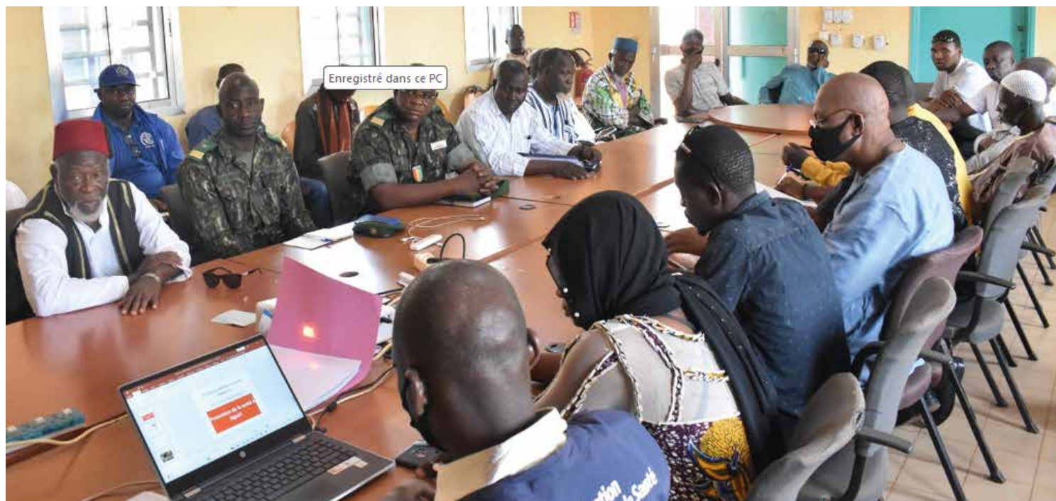
Session de plaidoyer sur la diphtérie avec les autorités locales et leaders religieux (Siguiri, mars 2024)

La région de Kankan a été le théâtre d'une série de sessions de plaidoyer visant à sensibiliser la population à la diphtérie.