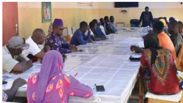
Session de plaidoyer sur la diphtérie avec les leaders communautaires (Kérouané, mars 2024)

À Siguiri, l'engagement actif des autorités locales et une participation accrue des membres de la communauté ont été des points forts. Cependant, le manque de suivi après la session a été identifié comme une faiblesse significative, soulignant la nécessité d'élaborer un plan de suivi post-session.