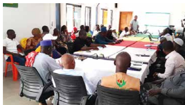
Session de plaidoyer en faveur de la vaccination (Kindia, avril 2024)

À mi-parcours, une évaluation de la mise en œuvre de ce plan a été entreprise pour analyser les résultats obtenus et planifier des activités pertinentes.