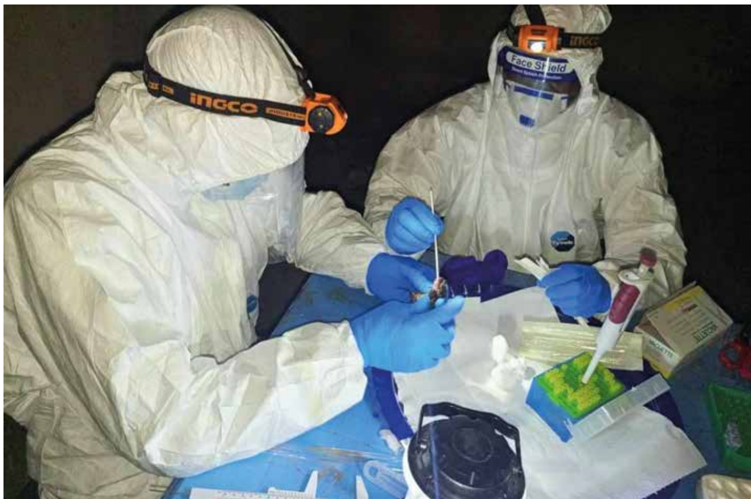
Des experts de la FAO font des prélèvements sur une chauve-souris (Nzérékoré, février 2024)

Le prélèvement de ces animaux a fourni 461 échantillons biologiques qui sont conservés à -80°C au laboratoire des FHV pour analyse. Ces opérations ont été effectuées avec la forte implication des communautés locales.