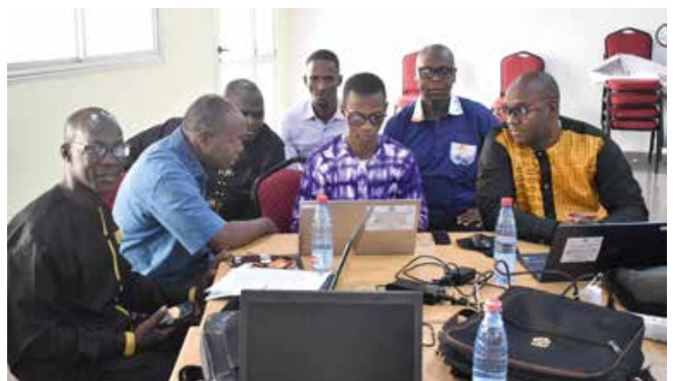
Travaux de groupe sur l'analyse des comportements à risque et identification des cibles prioritaires (Kindia, mars 2024)

Pour ce faire, plusieurs objectifs spécifiques ont été définis, notamment l'analyse des comportements à risque, l'identification des cibles prioritaires, la formulation des problèmes associés à ces cibles, et la proposition de contenus clés de messages ainsi que des canaux de communication appropriés.