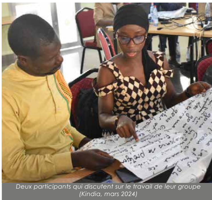
Deux participants qui discutent sur le travail de leur groupe (Kindia, mars 2024)

Cette méthodologie de travail a permis, à la fin de l'atelier, de disposer de tous les éléments essentiels pouvant aider à élaborer la stratégie, telle que souhaitée.