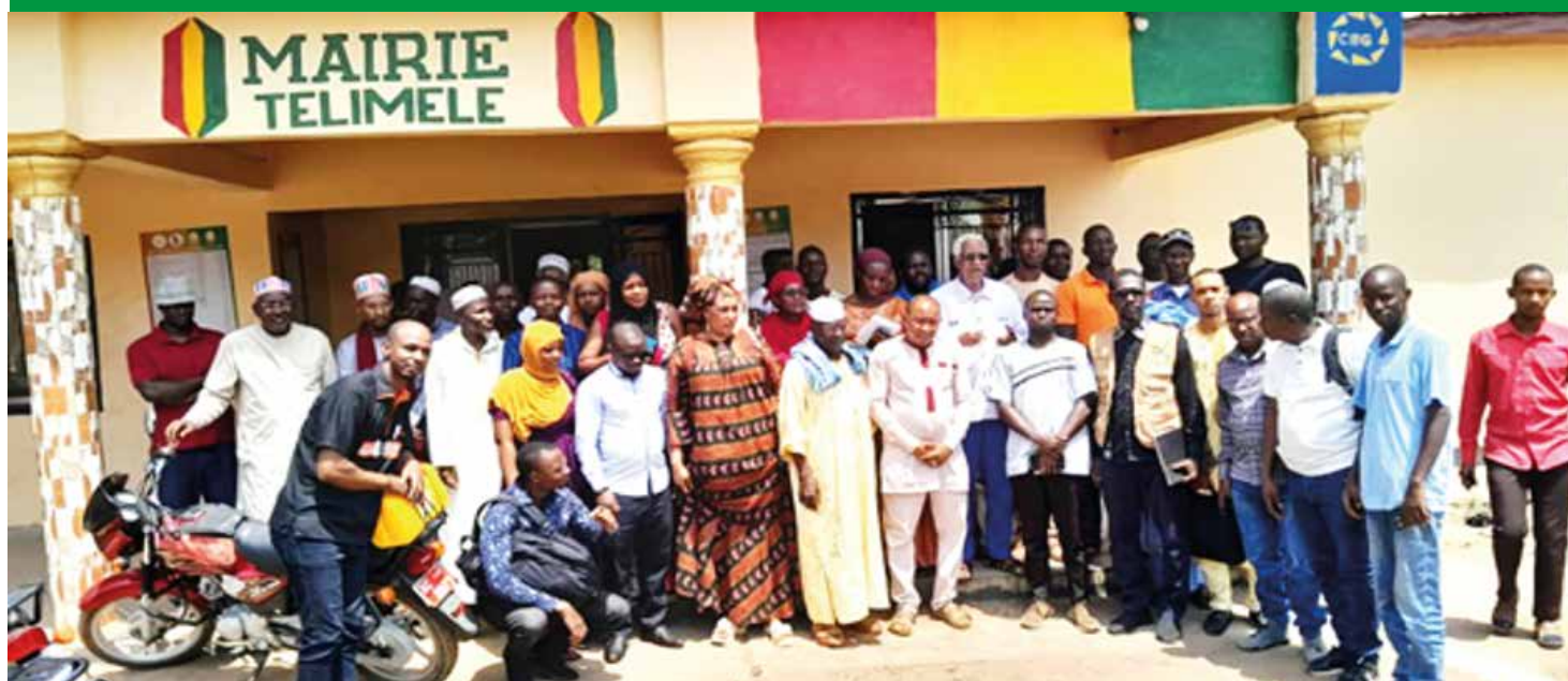
Photo de famille après une session de plaidoyer en faveur de la vaccination (Télimélé, avril 2024)

Le Service national de promotion de santé (SNPS) a réalisé une série de réunions de plaidoyer dans les préfectures de Télimélé et de Kindia, visant à mobiliser les autorités locales et les leaders d'opinion pour renforcer la vaccination. D'importants résultats et des recommandations découlant de ces réunions, soulignent l'importance cruciale de la vaccination dans la promotion de la santé publique en Guinée.