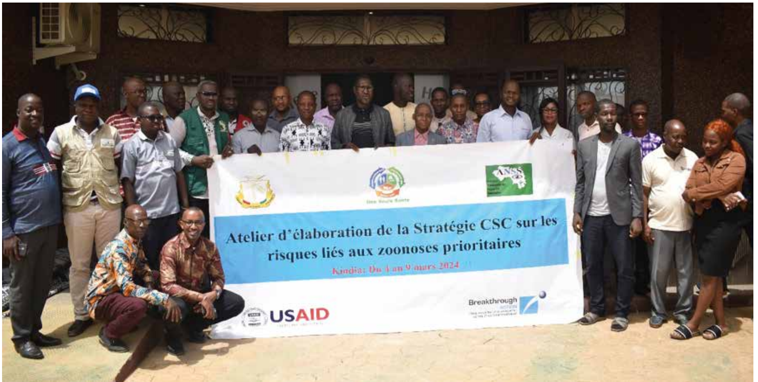
Photo de famille à l'ouverture de l'atelier d'élaboration de la stratégie de Changement social et de comportement sur les risques liés aux zoonoses prioritaires (Kindia, mars 2024)

La lutte contre les maladies zoonotiques constitue un enjeu majeur de santé publique en Guinée.