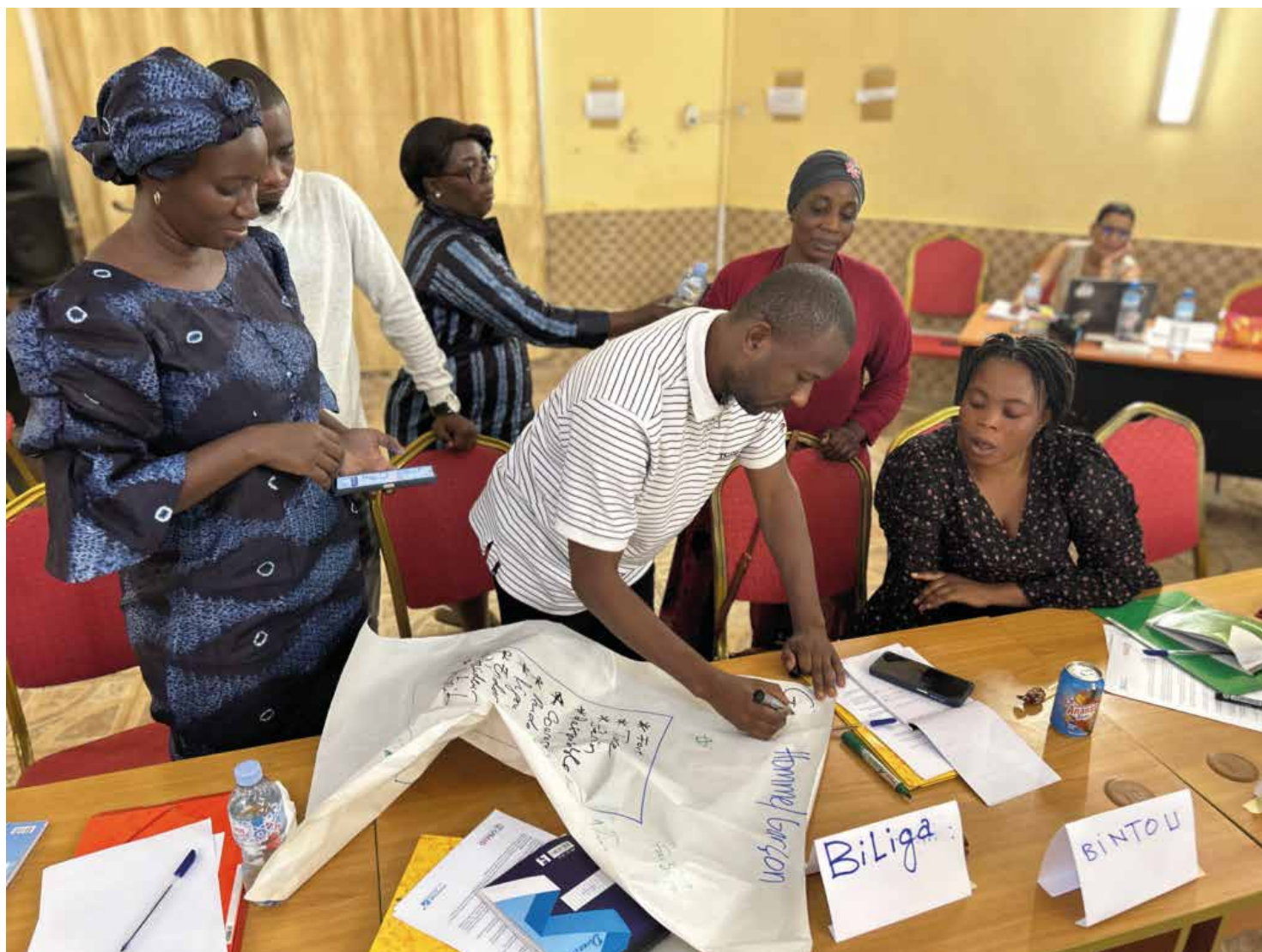
Durant une activité de groupe, des participants de Nzérékoré utilisent l'outil de vérification de l'égalité du genre pour évaluer le niveau d'intégration de la dimension de genre dans leurs activités de communication sur les risques et d'engagement communautaire existantes et en cours. (Kindia, février 2024)

Enfin, le programme de formation – actuellement en français – sera traduit en anglais et utilisé par d'autres pays de mise en œuvre de Breakthrough ACTION, ce qui amplifiera encore sa portée et son impact sur les efforts mondiaux d'intégration de la dimension de genre.