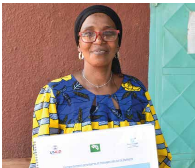
Le Point Focal Promotion de la Santé et Communication de Kouroussa reçoit son support de communication sur la diphtérie (Kouroussa, mars 2024)

À Kouroussa, la présence notable des leaders communautaires et l'utilisation efficace des ressources disponibles ont été des points positifs. Cependant, le besoin d'améliorer la coordination entre les différents acteurs impliqués a été identifié comme une faiblesse, conduisant à la recommandation d'organiser des réunions de coordination régulières.