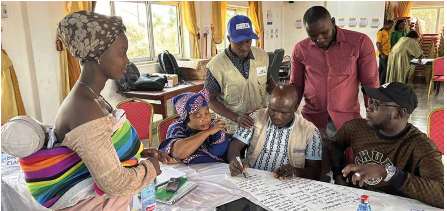
Les participants discutent de ce que signifie être un "homme" ou une "femme" dans leur communauté, comment sortir de ces normes, et quelles sont les récompenses et les conséquences qui en découlent. (Nzérékoré, février 2024)

D ans toutes les initiatives mondiales en matière de santé, l'intégration de la dimension de genre est apparue comme un aspect essentiel de la conception et de la mise en œuvre d'un programme efficace.