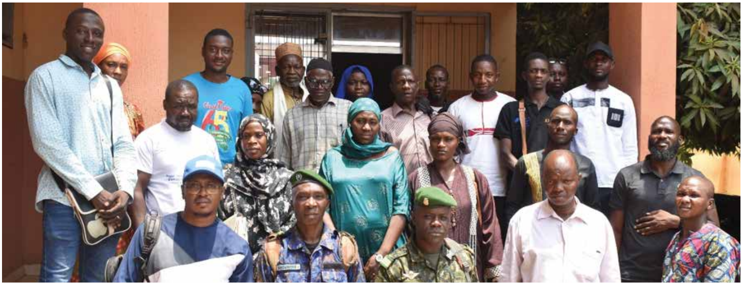
Photo de famille après une session de plaidoyer sur la diphtérie (Kankan, mars 2024)

La session à Kankan a été marquée par la participation active des représentants de l'USAID et une présentation efficace des messages clés sur la diphtérie. Cependant, l'absence de suivi prévu après la session a nécessité la proposition d'un mécanisme de suivi en collaboration avec l'USAID pour maximiser l'impact des sessions de plaidoyer.