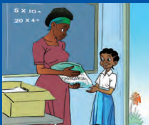
Mwanafunzi anapokea chandarua