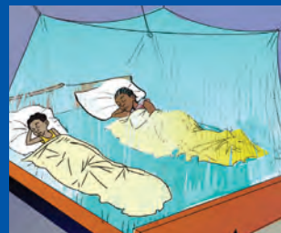
Familia wamelala kwenye chandarua