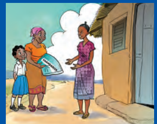
Mama akigawa chandarua cha ziada kwa jirani