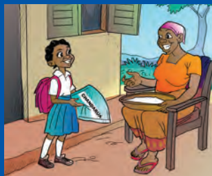
Mwanafunzi anamkabidhi mzazi chandarua