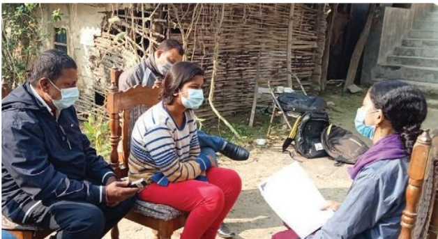
चित्र २: प्रमुख सचनादाता-किशोरीसँग अन्तर्वाता

हालका दशकहरूमा विवाह उमेरमा वृद्धि भएको देखिएतापनि नेपालमा बालविवाह, उमेर नपुगी र जबरजस्ती गरिने विवाह एक महत्वपूर्ण मुद्दाका रूपमा कायम छ। नेपालको कानून अनुसार विवाहयोग्य उमेर २० वर्ष पश्चात् हो। तथापी, मधेसका ६ वटा नगरपालिकाहरूमा सन् २०२२ - २०२३ मा गरिएको स्थानीय जनगणनाअनुसार, बालिकाहरूमाभ बालविवाह र उमेर नपुगी गरिने विवाहको व्यापकता या विद्यमानता भिन्न ३५ % देखि ५९% सम्म देखिएको छ, जुन नगरपालिकापिच्छे, कम या बढी छ।