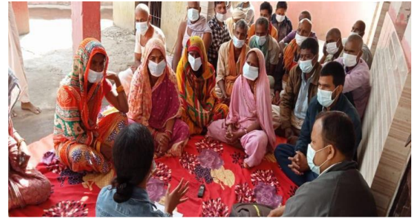
चित्र १: लक्षित समूह छलफलमा अभिभावकहरू

नेपालमा अमेरिकी अन्तर्राष्ट्रिय विकास नियोगको सहयोगमा ब्रेक थ्रु एक्सनको बालविवाह, उमेर नपुगी र जबरजस्ती गरिने विवाह न्यूनीकरणका लागि स्थानीय प्रणाली सुदृढीकरण परियोजना, नेपाल सरकारको स्थानीय संरचनाहरूको संस्थागत र प्राविधिक क्षमतालाई सुदृढ गरी बालविवाह, उमेर नपुगी र जबरजस्ती गरिने विवाह न्यूनीकरणका लागि प्रभावकारी सामाजिक व्यवहार परिवर्तनका योजना तर्जुमा, कार्यान्वयन, अनुगमन, मूल्याङ्कन र समन्वय सीप विकास गरी स्थानीय प्रणाली सुदृढ र बाल संरक्षणका संरचनाहरूको क्षमता अभिवृद्धि गरी बालविवाह, उमेर नपुगी र जबरजस्ती गरिने विवाह न्यूनीकरणका बाधाहरूलाई समुदायमा आधारित, सर्वपक्षीय समन्वय तथा तथ्यमा आधारित रही सम्बोधन गर्ने लक्ष्य लिएको छ।