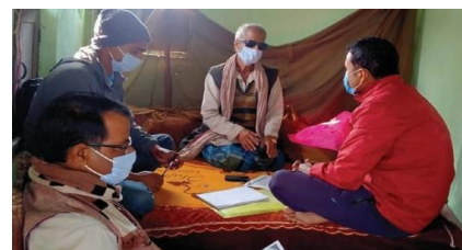
चित्र ४: प्रमुख सूचनादाता -सामुदायिक अगुवासँग अन्तर्वार्ता

२. समुदाय बालविवाह, उमेर नपुगी र जबरजस्ती गरिने विवाह प्रति उदासिन : समुदाय विशेषगरी शिक्षित र प्रभावशाली व्यक्तिहरूले बालविवाहको समस्या उनीहरूको होइन भन्ने सोच राख्छन् र,